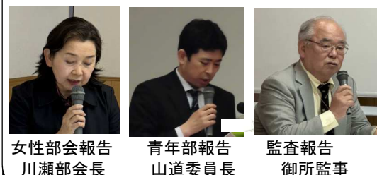
女性部会報告 川瀬部会長 青年部報告 山道委員長 監査報告 御所監事