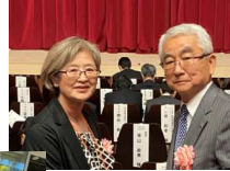
↑会場にて ←参加者 集合写真

先月10月14日(金曜日)建築士会全国大会(秋田)において連合会会長表彰を頂きました。長崎県建築士会の皆様方に御礼を申し上げます。大会は全国から3,000人余りの参加者で盛大に開催されました。翌日、レンタカーで秋田県をほぼ一周し、観光を楽しむことができました。一番印象に残ったのは田沢湖の美しさでした。雨上がりの青い湖面と澄んだ秋の空がとともまぶしかったです。湖面にはウグイスがたくさん群れていましたよ。夜は秋田名物の郷土料理と日本酒で楽しい時間を過ごすことができました。今後も微力ですが建築士会のために尽力したいと思っております。ありがとうございました。