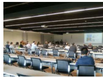
壱岐の木造4階建てのお話し パネル展示の前で青年部