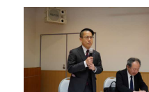
山口新支部長挨拶