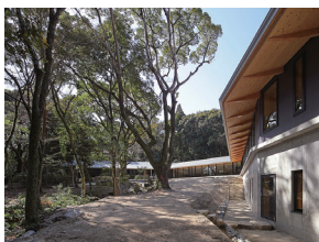
p39 / p110-111