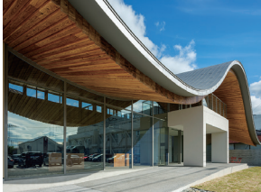
p9 / p50-51 © 八代哲弥

d&i 大黒屋新社屋 佐々木翔・鈴江佑弥・円酒昂 (株) INTERMEDIA / 円酒構造設計