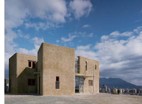
p16 / p64-65