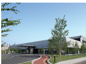
p40 / p112-113