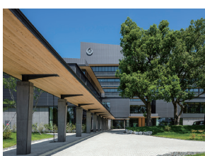
p42 / p116-117