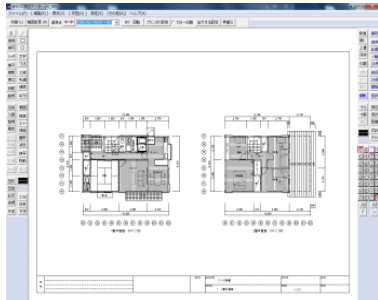
←実践建築設計2次元CAD技術 作成例 (JWCAD)